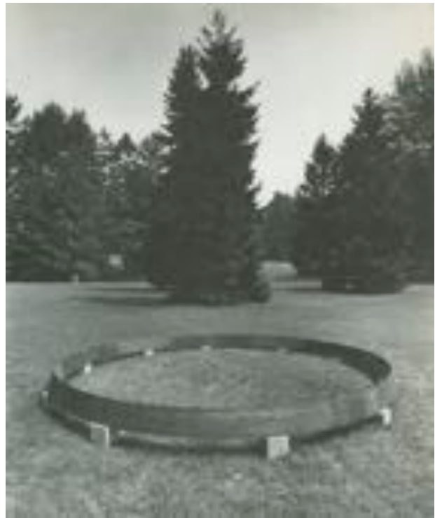
Eisengring: «The Circle» 1980 im Wenkenpark in Riehen

Mehrere herausragende Werke aus dieser Zeit gelangten im Anschluss an die Präsentationen in die Sammlungen des Kunstmuseums und der Emanuel Hoffmann-Stiftung. Zu kei-