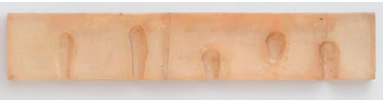
Witz und Lust auf Provokation: Naumans Knie-Stempel von (erfundenen) fünf berühmten Künstlern

Das heisst auch, dass Nauman mit grösstem Ernst zu Werke geht, indem er die möglichen Antworten auf seine Fragen akribisch plant und mit grosser Sorgfalt prüft. Gut möglich, dass dies für seine Interpreten besonders faszinierend erscheint. Sie schliessen daraus, dass alles, was dieser Prüfung standhält, eine letztgültige künstlerische Wahrheit enthält, an der es nichts zu rütteln gibt. Diese Ansicht verleitete Kritiker dazu, Naumans Kunst eine autoritäre Haltung vorzuwerfen. Sie übersahen dabei seinen Witz, seine Lust zu provozieren und seine Selbstzweifel, die in jeder seiner Arbeiten präsent sind. Kathy Halbreich, die Kuratorin der Retrospektive, bringt es in ihrem Katalog-Essay auf den Punkt: «In den fünf Jahrzehnten seiner Laufbahn hat Nauman uns den Wert der Skepsis bewusst gemacht und uns gelehrt, wachsam zu sein.» Wachsam auch gegenüber Naumans eigenen Werken. So besteht seine Arbeit «Wax impressions of the Knees of Five Famous Artists» ers-