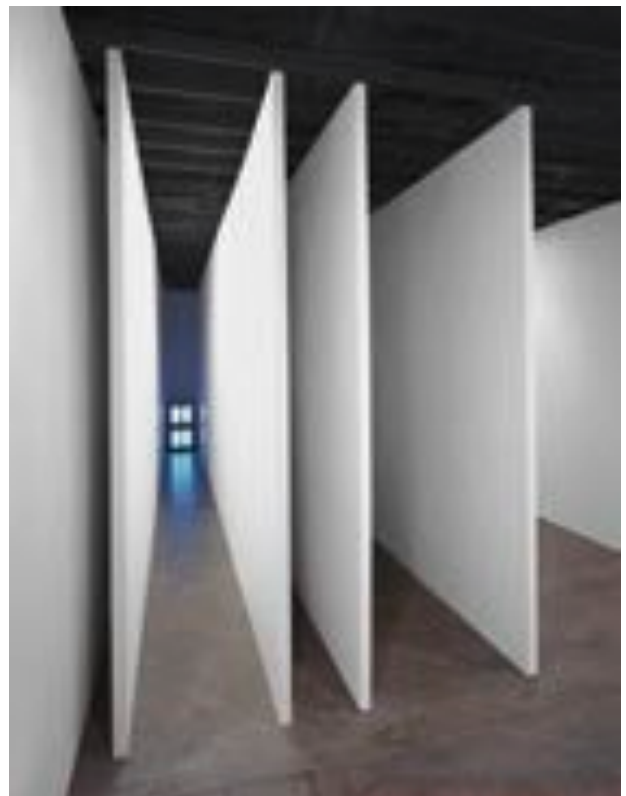
Korridor-Installation: Überwachte Enge