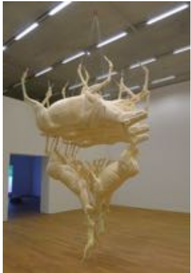
Umgekehrte Pyramide: Füchse, Karibus, Hirsche

Die Broschüre ist sehr hilfreich, ihre Lektüre sehr zu empfehlen. Sie bringt Ordnung in die Unübersichtlichkeit und schärft in den Be-