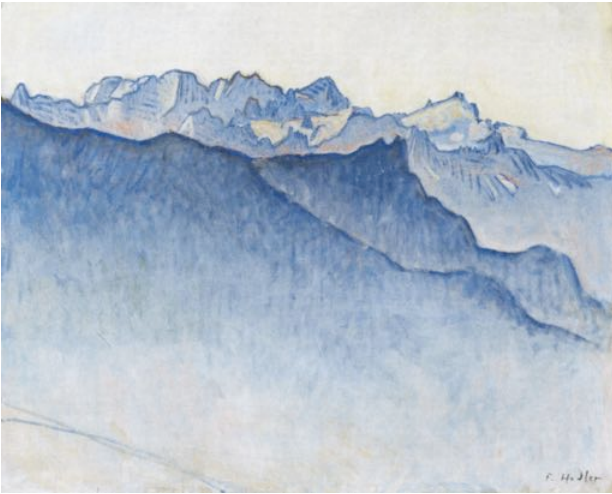
«Blick von Montana...»: Diagonaler Bildaufbau

wirkt beklemmend. In den ersten Bildern ist die Geliebte im Bett in sitzender Position vor einem warm-farbigem Hintergrund dargestellt. Nach und nach verändert sich die Position der Kranken. Sie muss von Kissen gestützt werden. Das Gesicht verliert seine Festigkeit; die Wangen fallen ein: ihre Züge werden kantig.