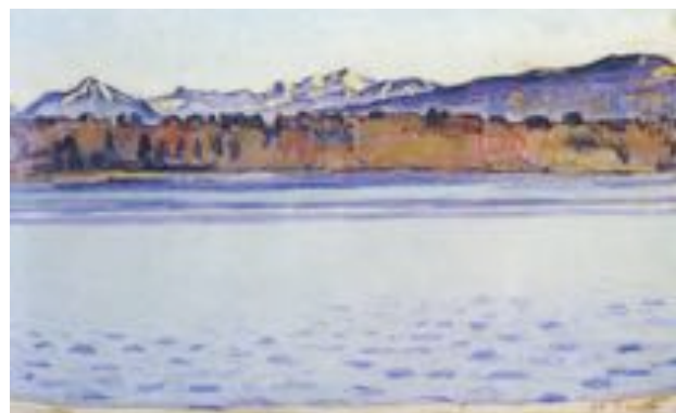
Landschaftsbilder (von oben) 1914, 1915, 1918, 1918

wunderer Johannes Widmer 1917 ankündigte, er werde «andere Landschaften als bisher» malen und ihn dabei mit Blick über den See darauf hinwies «wie da drüben alles in Linien und Raum aufgeht» ist kein schlüssiger Beweis für eine komplette Neuorientierung.