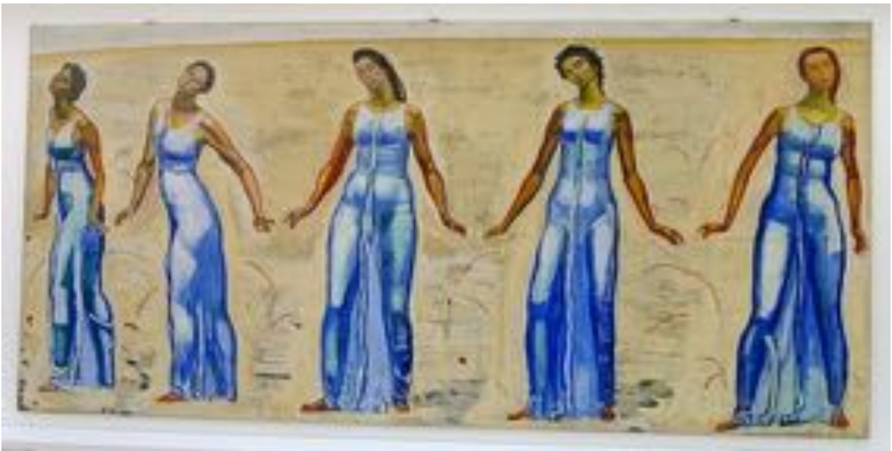
«Blick in die Unendlichkeit»: Fokussierung auf die Bewegung der Figuren und ihre Gesten

Und auch eine chronologische Betrachtung der Landschaftsbilder führt in die Irre. Denn Hodler benützte in seinen letzten Lebensjahren die ganze Palette seines konzeptionellen Repertoires – je nach Lichtverhältnissen und Stimmung, wie willkürlich ausgewählte Beispiele aus der Ausstellung belegen.