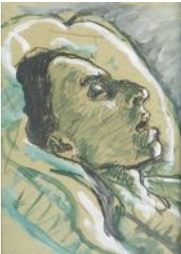
Sterbende Valentine (Ausschnitt): Hastige Skizze

Die Angriffe aus Deutschland waren für den Kunst-Star zweifellos schwere Kränkungen, existenzielle Not musste der 61-jährige des-